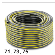
71, 73, 75