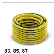
83, 85, 87