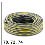
70, 72, 74