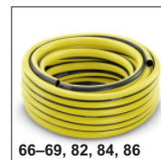
66-69, 82, 84, 86