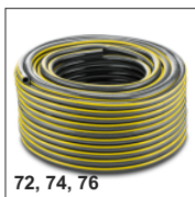
72, 74, 76