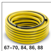
67-70, 84, 86, 88