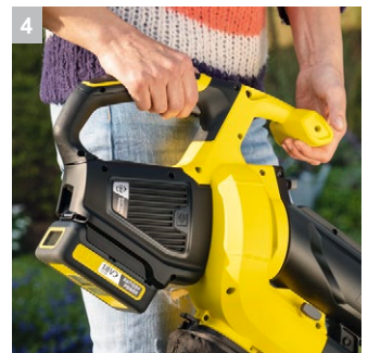
4 Вторая рукоятка