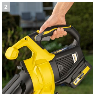
2 Регулировка частоты вращения