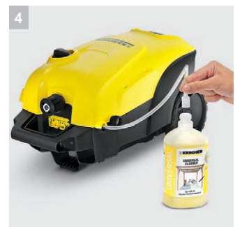
4 Трубка для забора чистящего средства